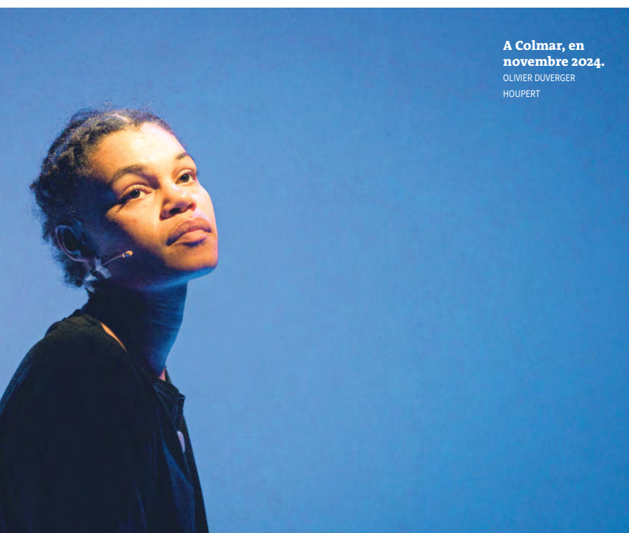
A Colmar, en novembre 2024.

Attaquée devant un café, en transit entre deux gares parisiennes, elle ne gaspille pas les minutes, même si ses phrases ne se précipitent pas pour atteindre leur point final. Elle arrive de Bretagne où elle jouait, la veille encore, dans L'Hôtel du libre-échange , de Georges Feydeau, mis en scène par Stanislas Nordey. Une aventure de troupe, 13 acteurs au plateau, qui lui permet de se déployer dans un « autre registre », car, tient-elle à préciser: « Je ne suis pas que l'interprète d'Une chose vraie. » Sa valise est posée à ses pieds. Elle va